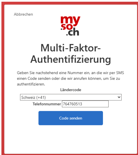
Abbildung 3 Eingabe Handynummer für 2FA

Um Fremdzugriff zu verhindern, ist Ihr Login mit der 2FA-Methode SMS geschützt. Suchen Sie im nächsten Schritt die korrekte Vorwahl aus und geben Sie Ihre Handynummer ein.