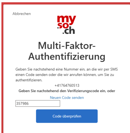
Abbildung 4 Bestätigung Registrierung mit SMS-Code

Sie können sich in dieser Ansicht auch einen neuen Code zustellen lassen oder mit «Abbrechen» einen Schritt zurück im Vorgang gehen.